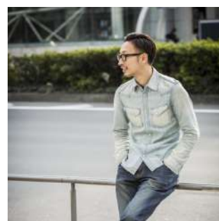
夕永貴教 フォトグラファー